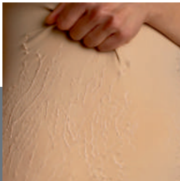
Foto Marlene Tullius, Bildrechte Helena Renner Titel der Abgebildeten Arbeit (Detail): „Worn Out“

Anmeldung: Erwünscht unter T. 06181 256556 oder info@gfg-hanau.de